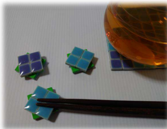
箸置き&コースター